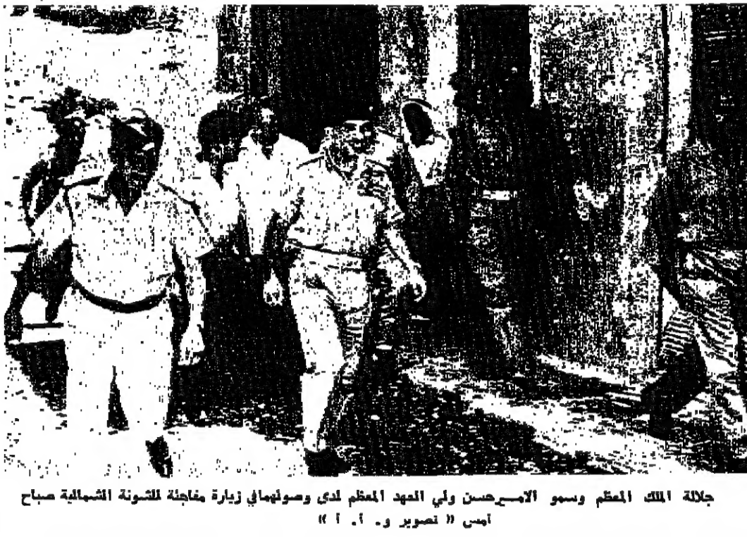
جلالة الملك المعظم وسمو الامير حسن ولي العهد المعظم لدى وصولهما الى زيارة مفاجئة للشؤون الشمالية صباح امس

لندن - اقليمية - اجتمع السيد عبد المتعم الرفاعي وزير خارجية الاردن لمدة ساعة الى المستر مايكل ستيفورت وزير خارجية بريطانيا. وحضر المقابلة السيد منحت جمعة سفير الاردن هنا. الوضع الحالي وتم ان المباحثات تناولت الموضوع الحالي بالنسبة الى قرار مجلس الامن الخاص بالشرق الاوسط وانتقم الذي اقره اثناء محادثات السيد الرفاعي هنا اخرا مع الدكتور غونار بارينغ المعوث الدولي الى الشرق الاوسط. اهمية قصوى وقال السيد الرفاعي بعد مقابلة المستر ستيفورت لقد كان حديثنا ذا الية على الصحة الخاصة عمود ٥